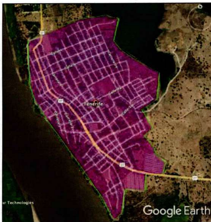
Ilustración 1 Área de Prestación Efectiva del Servicio de Acueducto Municipio de Tenerife

Del área de prestación efectiva del servicio de acueducto se excluyen las áreas o predios urbanizados definidos en el Decreto 1077 de 2015, o la norma que lo modifique, sustituya o adicione, que no tengan o no hayan culminado las obras de infraestructura de servicios públicos domiciliarios de acueducto y alcantarillado requeridos para su prestación, tales como: