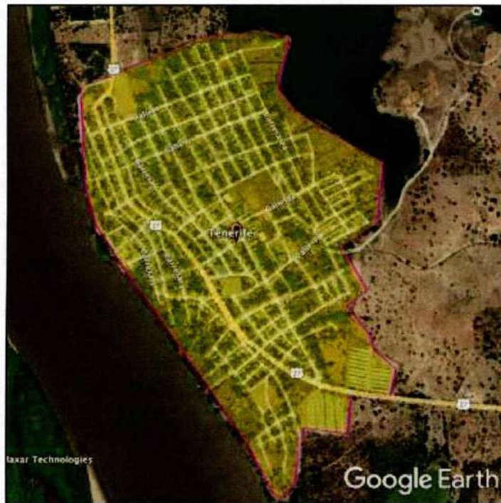
Ilustración 2 Área de Prestación Efectiva del Servicio de Alcantarillado Municipio de Tenerife

Del área de prestación efectiva del servicio de alcantarillado sanitario se excluyen las áreas o predios urbanizados definidos en el Decreto 1077 de 2015, o la norma que lo modifique, sustituya o adicione, que no tengan o no hayan culminado las obras de infraestructura de servicios públicos domiciliarios de acueducto y alcantarillado requeridas para su prestación, tales como: