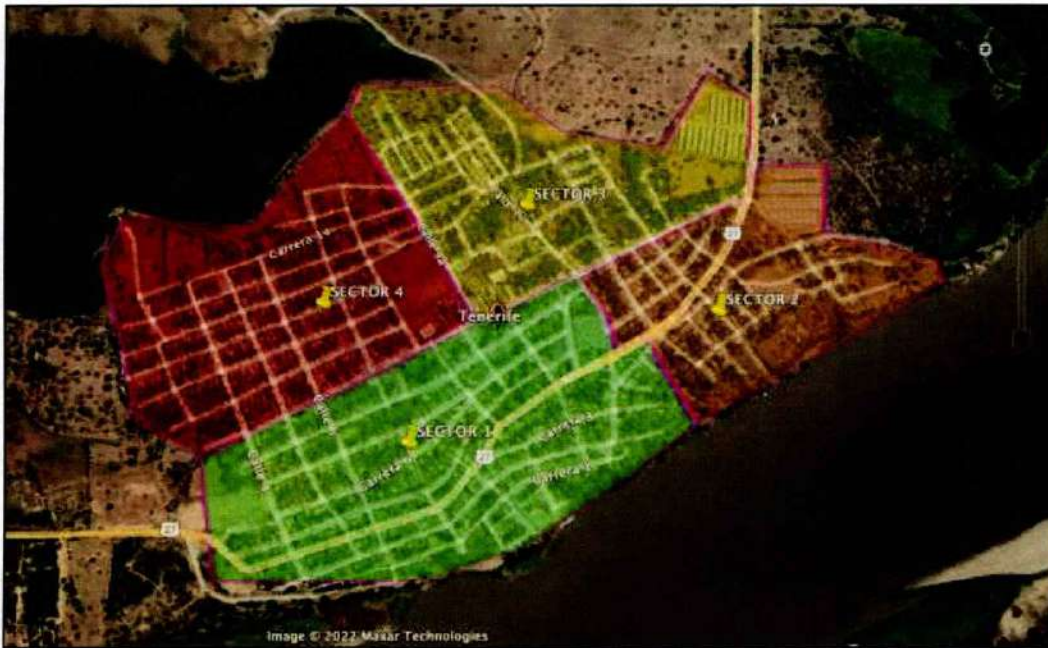
Tabla 3 esquema de prestación sectorizada.

El suministro de Aguas a área de prestación del Municipio de Tenerife se hace de manera simultánea mediante 4 sectores Hidráulicos con promedios de 17 horas/día.